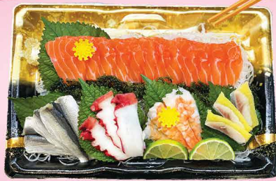
225-11-02 SASHIMI SET 285