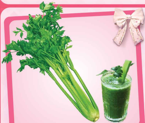
225-11-09 CẦN TÂY 500G UP