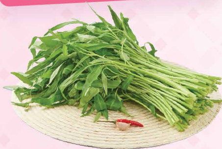
225-11-12 Rau Mồng 300g