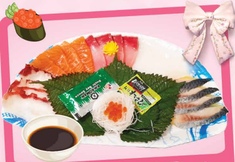
225-11-01 SASHIMI SET 199